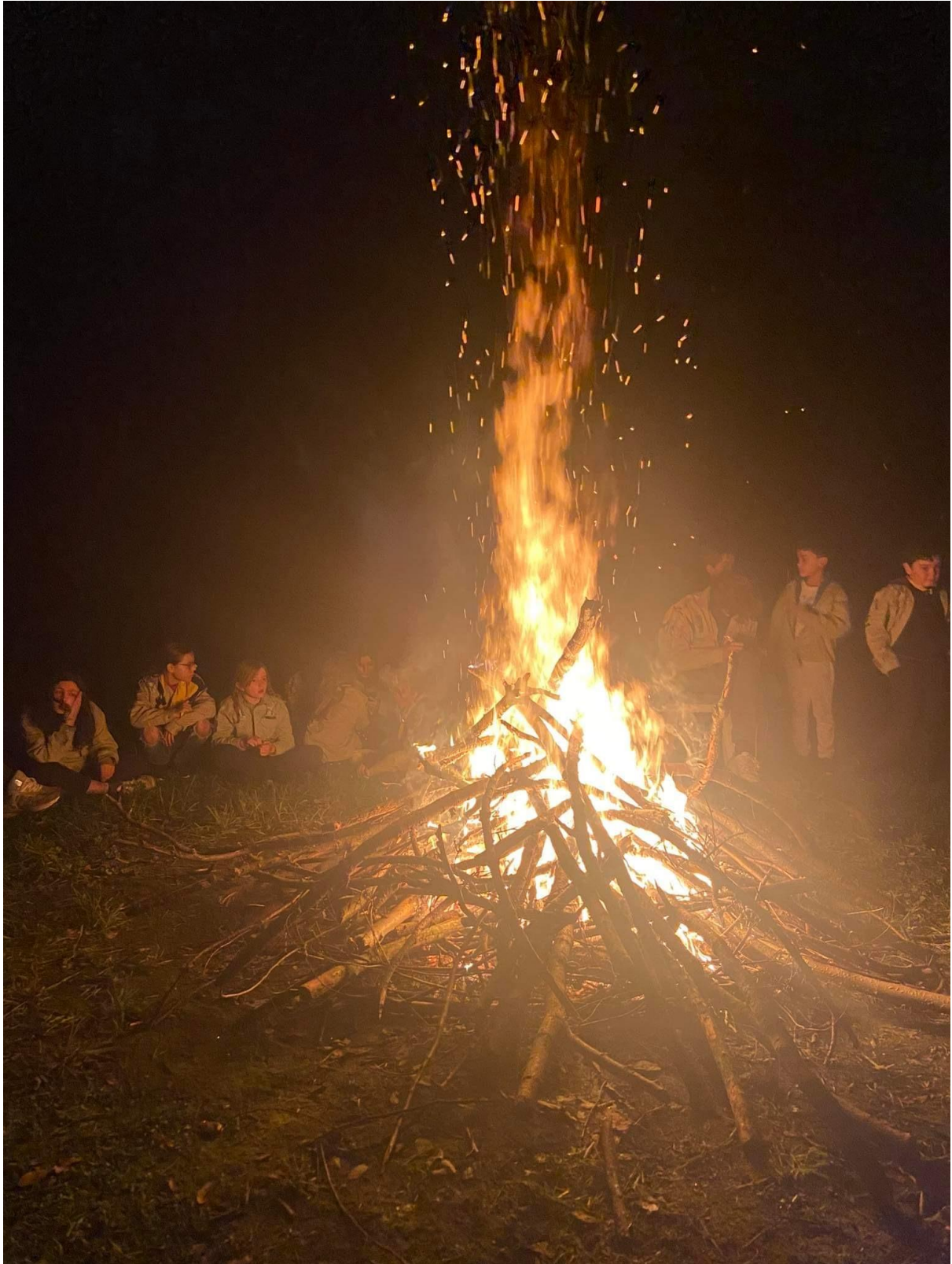
Shelter Januari - Mei 2023